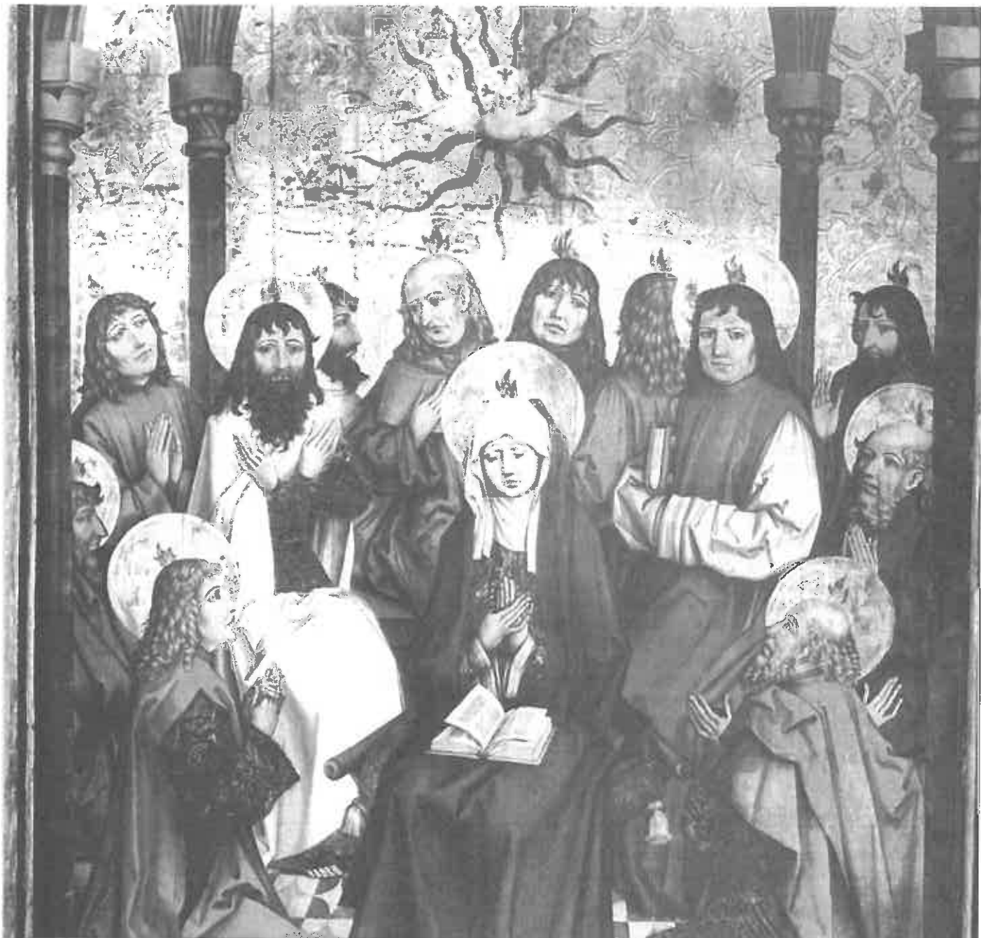
Pfingsten von Leu d'A, Kunsthau Zürich