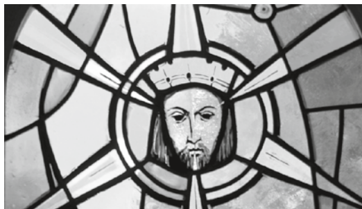
Fenster in der Bruder-Klaus-Kapelle, Burgbühl

Sonntag, 2. Juli 2017, 06.15 Uhr ab Freiburg Zweisprachig organisierte, kantonale Wallfahrt: Flüeli – Ranft – Sachseln , Anmeldung (bis 16. Juni 2017) und Infos auf www.kath-fr.ch/bruder klaus Organisation: Freiburger Stiftung zur Erhaltung des Wohnhauses von Niklaus von Flüe